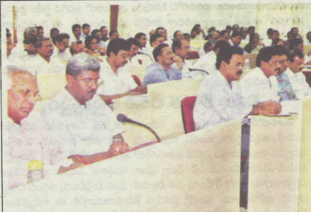
సమావేశానికి హాజరైన అధికారులు